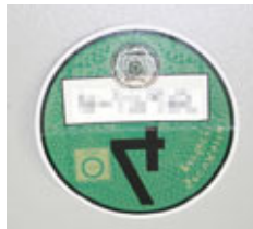
Grüne Umweltplakette

in der Umweltzone fahren. Hierüber ist ein entsprechender Nachweis mit einem Fahrtenbuch zu führen. Die Einhaltung der Kilometerbegrenzung wird kontrolliert. Mit der Bewilligung erhält der Antragsteller die Auflage, das Fahrtenbuch nach Ablauf von sechs Monaten der Landeshauptstadt Hannover zur Prüfung zu übermitteln. Mit Überschreitung der zulässigen Laufleistung erlischt die Bewilligung.